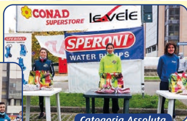
Categoria Assoluta DONNE