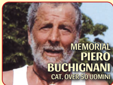
MEMORIAL PIERO BUCHIGNANI CAT. OVER 50 UOMINI

Per accedere all'Area del Ritrovo e delle Iscrizioni SARA' NECESSARIO PER TUTTI PRESENTARE IL MODULO DI AUTODICHIARAZIONE COVID 19 COMPILATO E FIRMATO.