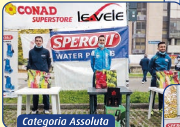
Categoria Assoluta UOMINI